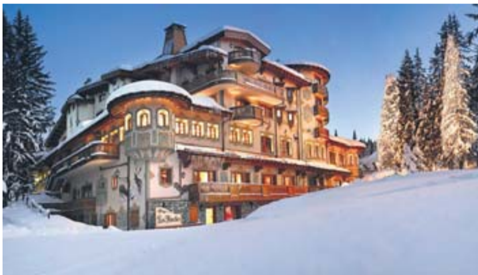
Biches éclairées, manège et patinoire privée : les Airelles, palace à Courchevel, réinvente l'univers merveilleux de Sissi.