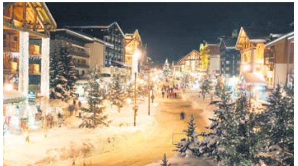
Dans cette illumination baptisée 'Déambulation féerique' à Val-d'Isère, seuls les piétons ont droit de cité et ils ne le regrettent pas.

Après une fin d'automne particulièrement agitée dans l'actualité professionnelle, vous avez forcément envie de changer d'air (et nous aussi).