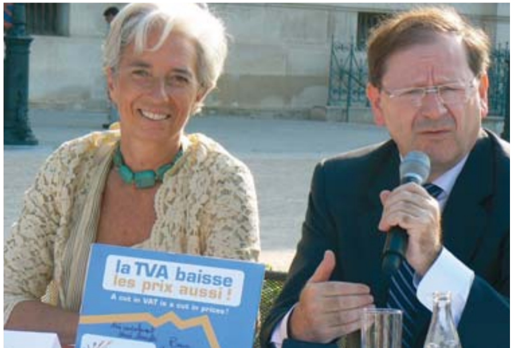
Christine Lagarde et Hervé Novelli, le 30 juin dernier, lancent "le début d'une histoire".

C'est la fin d'un combat et le "début d'une histoire" : en lançant officiellement l'entrée en vigueur de la baisse du taux de TVA depuis le restaurant Le Saut du Loup, à Paris, la ministre de l'Économie Christine Lagarde et le secrétaire d'État au Tourisme Hervé Novelli ont souligné la solennité du moment (voir pages 2