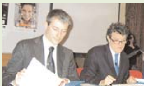
Jean-Louis Borloo et Laurent Hénart ont signé un accord cadre national pour le développement de l’apprentissage.

Vous êtes un hôtelier ou un restaurateur du type TPE, PME ou grande entreprise et vous peinez à recruter ? Le pilier ‘jeunes’ du plan de cohésion sociale devrait vous intéresser. Plusieurs mesures concernent la profession. Coup de zoom sur certaines nouveautés et explications dans une interview exclusive de Laurent Hénart, secrétaire d’État à l’insertion professionnelle des jeunes. Le remaniement ministériel ne devrait pas remettre en cause ce dispositif.