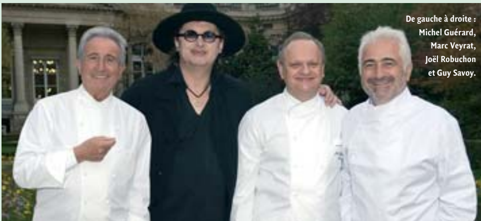
De gauche à droite : Michel Guérard, Marc Veyrat, Joël Robuchon et Guy Savoy.