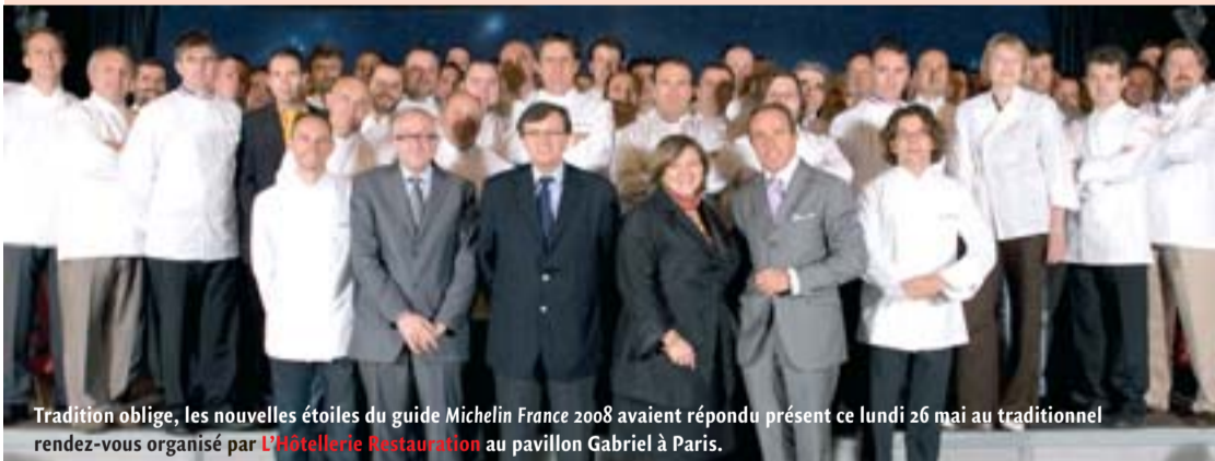
Tradition oblige, les nouvelles étoiles du guide Michelin France 2008 avaient répondu présent ce lundi 26 mai au traditionnel rendez-vous organisé par L'Hôtellerie Restauration au pavillon Gabriel à Paris.