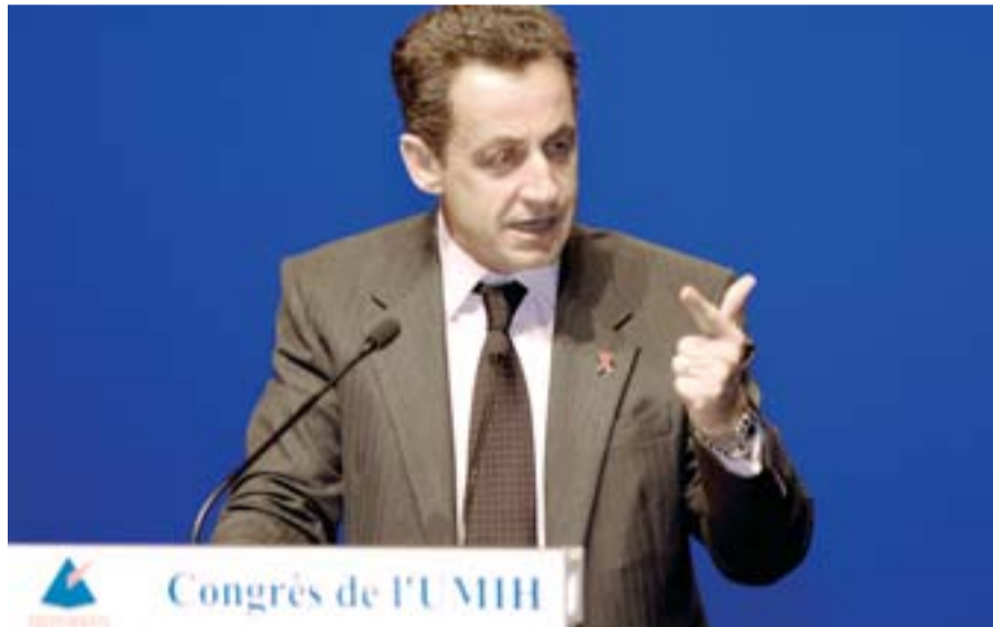
Nicolas Sarkozy en décembre 2006 devant le congrès de l'Umih : "Je tiendrai la promesse qui vous a été faite de baisser la TVA sur la restauration."

la profession, sur le terrain, s'est souvent sentie abandonnée. Mais le chef de l'État vient de relancer le dossier - et sans détours - au micro de RTL, en déclarant qu'il allait faire bouger la règle européenne et "honorer" la promesse faite aux restaurateurs.